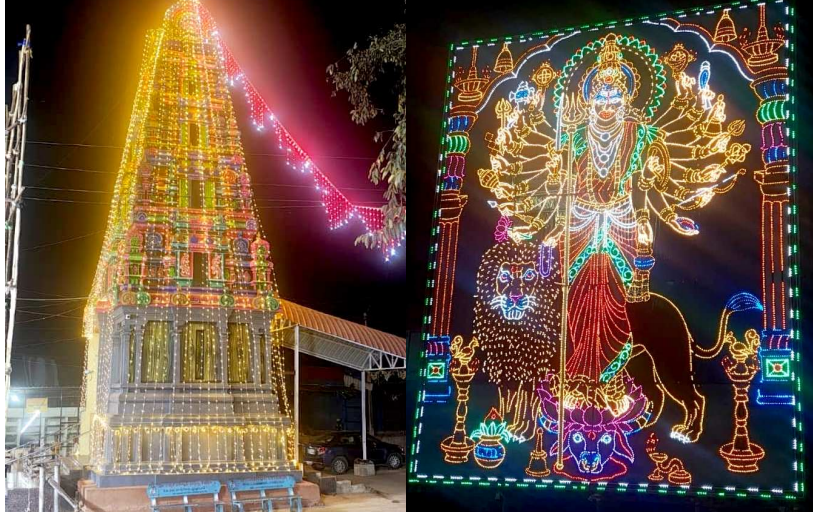
ఆకట్టుకునే సాగత తోరణాలు

మూడు రోజుల పాటు జరుగుతున్న ఏడుపాయల వనదుర్గా మాత జాతర ఉత్సవాలను దృష్టిలో పెట్టుకొని దుర్గామాత ఆలయాన్ని వివిధ రకాల రంగులతో అలంకరించారు. దీనికి తోడు రాజగోపురం నూతన రంగులతో అలంకరించారు. అంతేకాకుండా ఆలయం చుట్టూ రంగురంగుల విద్యుత్ దీపాలను సైతం అలంకరిస్తున్నారు. రాత్రిపూట ఆలయం మిరుమిట్ట గొలిపేందుకు లేజర్ లైట్లను సైతం ఏర్పాటు చేస్తున్నారు. రాత్రి పూట కొన్ని కిలోమీటర్ల మేర ఈ లైట్ల కాంతితో ఏడుపాయల ఆలయం తలతళలాడ నుంది. భక్తులను