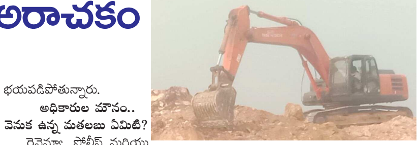
భయపడిపోతున్నారు. అధికారుల మోసం.. వెనుక ఉన్న మతలబు ఏమిటి? రెవెన్యూ, పోలీస్ మరియు మైనింగ్ శాఖల అధికారులు ఈ అరాచకాన్ని కళ్ళారా చూస్తున్నా పట్టించుకోకపోవడం వెనుక పెద్ద ఎత్తున మామూళ్ళు అందుతున్నాయనే ఆరోపణలు బలంగా వినిపిస్తున్నాయి. కొంతమంది స్వచ్ఛంద సంస్థల ప్రతినిధులు, రైతులు ఆర్టీఐ ద్వారా వివరాలు కోరినా, సంబంధిత అధికారులు నీళ్ళు నములుతూ సమాచారాన్ని దాటవేస్తున్నారు. ఈ మధ్యకాలంలో టీపుర్ల పట్టుకుని కేసులు నమోదు చేసినప్పటికీ తన మట్టి మాఫియా వ్యాపారం మాత్రం యధావిధిగా సాగుస్తున్నాయి. ఎవరైతే నాకోటి నా మట్టి మాఫియా వ్యాపారం తగ్గి లేదంటూ మట్టి దండా కొనసాగిస్తున్నారు. కాళ్ళ పట్టుకోవడం.. దండా కొనసాగించడం!...?

సత్తుపల్లి, మార్చి 24 : ఖమ్మం జిల్లా సత్తుపల్లి పట్టణం, పరిసర ప్రాంతాల్లో మట్టి దండా మూడు పువ్వులు ఆరు కాయలుగా పద్దిల్లుతోందనే ఆరోపణలు వస్తున్నాయి. ఏ పార్టీ అధికారంలో ఉన్నా ఏ ప్రభుత్వం మారినా ఈ 'మట్టి బాబు' సామ్రాజ్యానికి మాత్రం ఎదురులేకుండా పోతోంది. అధికారులను ఎలా బుట్టలో వేసుకోవాలో, ఎవరి కాళ్ళు పట్టుకుంటే తన వ్యాపారం సాఫీగా సాగుతుందో ఈ బాబుకు వెన్నతో పెట్టిన విద్యగా మారింది. కనుచూపు మేరలో గోతులు...? ప్రాణాల మీదకు వస్తున్న దండా! సత్తుపల్లి నుండి రేణుగ్రామానికి వెళ్లే ప్రధాన రహదారికి ఇరువైపులా నిబంధనలకు విరుద్ధంగా భారీ గోతులు తవ్వి మట్టిని తరలిస్తున్నారు. రాత్రివేళల్లో ఈ గోతులు కనపడక అనేకమంది బాటసారులు ప్రమాదాల బారిన పడుతున్నారు. మైనింగ్ అధికారులకు మాత్రం చీమ కుట్టినట్లుగానే ఉంటుంది. "ఎదుటివారి ప్రాణాలు పోతే మాకోటి? మా జేబులు నిండితే చాలు" అన్నట్లుగా ఈ అక్రమ వ్యాపారం సాగుతోంది అని, ప్రజల ఆరోపిస్తున్నారు. రోడ్లపై టీపుర్ల వీరహింస...!!-మద్యం మత్తుతో డ్రైవర్లు! ఈ దండాలో పాల్గొంటున్న డిప్యూటీ డ్రైవర్లు పట్టణ వీధుల్లో యమదూతల్లా ప్రవహిస్తున్నారు. మద్యం మత్తుతో అతివేగంతో వాహనాలు నడుపుతూ జనాన్ని హడలెత్తిస్తున్నారు. ఎవరైనా డైర్యం చేసి ప్రశ్నిస్తే, "మీ చేతనెంది చేసుకోండి.. పోయి బాబును అడగండి" అంటూ బరితెగించి సమాధానమిస్తున్నారు. సామాన్య ప్రజలు ఈ టీపుర్ల రాకతో రోడ్డుపైకి రావాలంటేనే