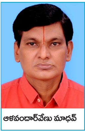
అశనందార్ వేణు మాధవ్

ప్రవేశపెట్టబడినా అది కేవలం మరణించిన కార్మికుల కుటుంబాలకు మాత్రమే పరిమితమైంది. 1975లో కోల్ ఇండియా స్థాపించబడినప్పటికీ, 1998 వరకు పూర్తి స్థాయి వృద్ధాప్య పెన్షన్ వ్యవస్థ అందు బాటులో లేదు. ఇది పరిస్థితి సింగరేణి సంస్థలో కూడా కొనసాగింది. కార్మికుల నిరంతర డిమాండ్ ఫలితంగా 1998లో కోల్ మైన్స్ పెన్షన్ స్కీం ప్రవేశపెట్టబడింది. ఈ స్కీం ద్వారా ఉద్యోగులకు నెలవారీ పెన్షన్ అందించే వ్యవస్థ ఏర్పడింది. ఇది కార్మికుల భవిష్యత్తుకు ఒక అశా కిరణంగా నిలిచింది. ఈ స్కీం కోసం ప్రత్యేకంగా కొత్త నిధి సృష్టించ కుండా, పాత ఫ్యామిలీ పెన్షన్ స్కీం నిధులు, ఉద్యోగి మరియు యాజమాన్యం కాంట్రీబ్యూషన్లు, కేంద్ర ప్రభుత్వ భాగస్వామ్యంతో ఒక సమిష్టి నిధి ఏర్పాటు చేయబడింది. అయితే, కాంట్రీబ్యూషన్ శాతం చాలా తక్కువగా ఉండటం ఈ స్కీం బలహీనతకు ప్రధాన కారణంగా మారింది. ఉద్యోగి మరియు యాజమాన్యం వాటా కలిపి సుమారు 2.33 శాతం మాత్రమే ఉండగా, కేంద్ర ప్రభుత్వం 1.16 శాతం మాత్రమే అందిస్తోంది. ప్రస్తుతం కోల్ ఇండియా మరియు సింగరేణి సంస్థలలో లక్షలాది మంది పెన్షన్లకు చాలా తక్కువ మొత్తంలో జీవిస్తున్నారు. పెన్షన్ రూ. 1000 నుండి రూ. 3000 మధ్య ఉండటం, ద్రవ్యోల్బణం పెరగడం, వైద్య ఖర్చులు అధికం కావడం వంటి కారణాలతో వారు తీవ్రమైన ఆర్థిక ఇబ్బందులు ఎదుర్కొంటున్నారు. పెన్షన్లో డియరీనెస్ అలవెన్స్ లేకపోవడం, పెన్షన్ పెంపు లేకపోవడం, చెల్లింపుల్లో ఆలస్యం వంటి సమస్యలు