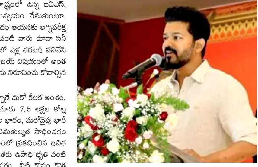
విస్తరణ, నైపుణ్యాభివృద్ధి వంటి రంగాల్లో విజయ్ ప్రభుత్వం విప్లవాత్మక మార్పులు తీసుకురావాలని ఆశిస్తున్నారు. ఒకప్పుడు అభిమానులుగా ఉన్నవారు ఇప్పుడు ఓటర్లుగా మారి తమ హక్కులను డిమాండ్ చేస్తున్నారు. ఈ అంచనాలను అందుకోలేకపోతే, అదే యువత వ్యతిరేక గళం ఏపిస్తే ప్రమాదం కూడా ఉంది.

జాతీయ రాజకీయాల కోణంలో చూస్తే విజయ్ ఎదుగుదల ఒక కొత్త చర్యకు దారితీసింది. దక్షిణాది రాష్ట్రాల్లో ప్రాంతీయ అస్థిత్వం బలపడుతున్న తరుణంలో, సినీమా గ్రామర్ మరియు యువత రాజకీయ చైతన్యం ఎలా ప్రభావితం చేస్తాయనే దానికి విజయ్ ఒక ప్రయోగశాలగా మారారు. జాతీయ పార్టీలైన బీజేపీ, కాంగ్రెస్ లకు తమిళనాడులో పట్టు బిక్కుడం కష్టమవుతున్న తరుణంలో, విజయ్ వంటి కొత్త తరం నాయకులు ప్రాంతీయ ఆకాంక్షలకు ప్రతినిధులుగా నిలుస్తున్నారు. ఇది భవిష్యత్తులో జాతీయ రాజకీయ సమీకరణాల్లో కీలక పాత్ర పోషించవచ్చు. అసెంబ్లీలో విశ్వాస పరీక్ష నెగ్గడం అనేది విజయ్ సుదీర్ఘ రాజకీయ ప్రయాణంలో మొదటి మెట్టు మాత్రమే. సినీమా మాటాగిల్లో రిటేక్ లు ఉంటాయి కానీ, రాజకీయాల్లో ప్రజా తీర్పు విషయంలో రిటేక్ లు ఉండవు. ప్రతి నిర్ణయం, ప్రతి చర్య ప్రజా క్షేత్రంలోనే పరీక్షించబడుతుంది. ప్రజల ఆశలు, కూటమి భాగస్వాముల సర్దుబాటు, ఆర్థిక నిర్వహణ, సామాజిక సమతుల్యత... ఈ నాలుగు స్తూభాలపైనే విజయ్ నర్తారు మనుగడ ఆధారపడి ఉంది. ఒక సాధారణ నటుడి నుంచి అసాధారణ ప్రజా నాయకుడిగా ఎదిగిన విజయ్, తమిళనాడు ప్రజల ఆకాంక్షలను నెరవేర్చి 'మంచి ముఖ్యమంత్రిగా పేరు తెచ్చుకుంటారా?' లేదా కేవలం ఒక రాజకీయ ప్రయోగంగా మిగిలి పోతారా? అన్నది రాబోయే బడ్జెట్ పాలనలో తేలిపోతుంది. ప్రస్తుతానికి మాత్రం తమిళనాడు గడ్డపై కొత్త రక్తం, కొత్త ఆలోచనలు పరిపాలనా పగ్గాలు చేపట్టడం శుభవరణామం. ఆయన తన శక్తిసామర్థ్యాలతో తమిళనాడును అభివృద్ధి పథంలో నడిపించాలని ఆశిద్దాం. - వ్యాసకర్త : సీనియర్ ఇండిపెండెంట్ జర్నలిస్ట్ కాలమిస్ట్.