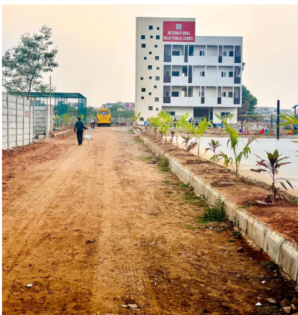
అధికారుల 'మౌన ప్రతం' వెనుక రహస్యమేంటి?

(ప్రజాసర్వే ప్రతినీధి) పటాన్ చేరు, మే 19 : అక్షర అక్షరాలు నేర్పించాల్సిన విద్యాసంస్థ. ఆక్రమణల పాతాలు నేర్చుకుంటోంది! ప్రభుత్వ భూములను కాపాడాల్సిన అధికారులే.. కానుల కక్కురితో ప్రైవేటు శక్తులకు రెడ్ కార్పిట్ పరుస్తున్నారు. నిరుపేదలకు దక్కాల్సిన అసైన్డ్ భూమిని, ప్రభుత్వ రస్తాను ఓ అంతర్జాతీయ పాఠశాల తన స్వార్థానికి వాడుకుంటున్నా.. కంటితుడుపు చర్యలు కూడా కరువయ్యాయి. ఇస్పాహూర్ మున్సిపాలిటీ పరిధిలోని 'ఇంటర్నేషనల్ ఢిల్లీ పబ్లిక్ స్కూల్' ఐ.డి.పీ.ఎన్ వ్యవహారంలో స్థానిక విద్యాకాఖ అధికారి ఏం.ఈ.ఓ స్కూల్ యాజమాన్యం కుమ్మత్తైన తీరు ఇప్పుడు స్థానికంగా తీవ్ర సంచలనంగా మారింది.