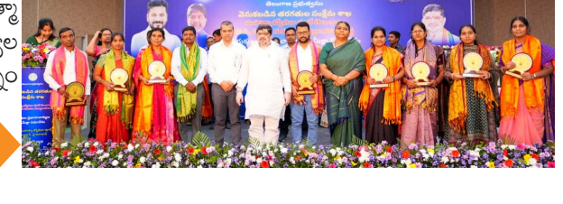
హైదరాబాద్, మే 21 : మహాత్మా జ్యోతిరావు ఫూలే గురుకుల విద్యాలయాల పనితీరు పై మంత్రి పాస్కం ప్రభాకర్ గారు గురువారం సమీక్ష సమావేశం నిర్వహించారు.

- విద్యార్థులకు సమగ్ర విద్యాబోధన జరగాలి - 8 వ తరగతి నుండే నీట్, ఎంసీటీ తర్జీమ - 100 శాతం ఉత్తీర్ణత సాధించిన పాఠశాలలకు అభినందనలు - ఫలితాలు తక్కువగా వచ్చిన స్ట్రీట్ స్కూల్ లకు హెచ్చరిక - పూలే గురుకుల పాఠశాలల ఫలితాలపై సమీక్షలో మంత్రి పాస్కం హైదరాబాద్, మే 21 : మహాత్మా జ్యోతిరావు ఫూలే గురుకుల విద్యాలయాల పనితీరు పై మంత్రి పాస్కం ప్రభాకర్ గారు గురువారం సమీక్ష సమావేశం నిర్వహించారు.