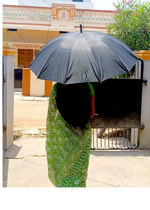
పెంచడానికి ముందుకు వస్తారని అంటున్నారు. ఇప్పటికైనా ప్రభుత్వాలు స్పందించి చెట్లను వివరీతంగా పెంచాలని, చెట్ల పెంచకలో ప్రజలకు అవకాశం కల్పించాలని వారిని ఈ కార్యక్రమంలో భాగస్వామ్యం చేయాలని వర్తమాన ప్రతిపాదిం చేశారు.

ప్రజలక్ష్యం ప్రతినిధి భూపూర్, మే 21 : భానుడి దగడగలతో ప్రజల బ్రతుకులు విలవిలలాడిపోతున్నాయి. తెలంగాణలోని చాలా ప్రాంతాలలో 45 నుండి 46 డిగ్రీల ఉష్ణోగ్రతలు నమోదవుతున్నాయి. ఇంటిలో ఉంటే ఉక్క పోత, ఇంటి బయటకు వస్తే సూర్యుడి మోత అన్నట్లు తయారైంది ప్రస్తుత వాతావరణం. ఇంటిలో ఉండలేక ఇంటి బయటకు రాలేక ప్రజలు సతమతమవుతున్నారు. కొందరు ఉదయాన్నే ఊరు బయట చెట్ల కిందికి, అడవిలోనికి వెళ్లి సేద తీరుతున్నారు. ఎప్పుడూ లేని విధంగా ఈ సంవత్సరం