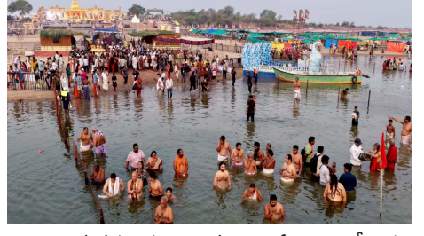
తాత్కాలిక గదులను 300కు పైగా ఏర్పాటు చేశారు. నదిలో లోతులోకి వెళ్లకుండా భద్రతా చర్యల్లో భాగంగా తాళ్లతో హద్దులు ఏర్పాటు చేశారు. జూన్ 1 వరకు ప్రతిరోజూ సాయంత్రం హారతి ఉంటుంది. అంత్య పుష్కరాలకు భక్తులు పెద్దసంఖ్యలో వచ్చే అవకాశం ఉందని అధికారులు అంచనా వేస్తున్నారు. తెలుగు రాష్ట్రాలతో పాటు ఒడిశా,

- కంచి పీఠాధిపతి విజయేంద్రసరస్వతి రాక - పుణ్యస్నానాలు ఆచరించిన మంత్రులు సురేఖ, శ్రీధర్ బాబు (ప్రజాఅక్షయ ప్రతినిధి) కాళేశ్వరం, మే 21 : సరస్వతీ నది అంత్య పుష్కరాలు వైభవంగా ఆరంభమయ్యాయి. గురువారం ఉదయం కంచి కామకోటి పీఠాధిపతి జగద్గురు శ్రీధర్ బాబు, కండా సురేఖ పుష్కరాలను ప్రారంభించారు. వీరంతా తొలుతు పుష్కరస్నానం ఆచరించి ప్రారంభించారు. పుష్కరాలకు వచ్చే భక్తుల కోసం రాష్ట్ర ప్రభుత్వం పెద్దఎత్తున ఏర్పాట్లు చేసింది. ప్రభుత్వం ప్రత్యేక చొరవ చూపి తొలిసారి అంత్య పుష్కరాలు నిర్వహిస్తోంది. వేసవి తీవ్రతను దృష్టిలో పెట్టుకొని అసాకార్యం కలగకుండా భారీ టెంట్లు, కూలర్లు సైతం ఏర్పాటు చేశారు. సరస్వతీ ఘాట్ తోపాటు ప్రధాన ఘాట్ వద్ద స్నానాలు ఆచరించేవారు దుస్తులు మార్చుకొనేందుకు తాత్కాలిక గదులను 300కు పైగా ఏర్పాటు చేశారు. నదిలో లోతులోకి వెళ్లకుండా భద్రతా చర్యల్లో భాగంగా తాళ్లతో హద్దులు ఏర్పాటు చేశారు. జూన్ 1 వరకు ప్రతిరోజూ సాయంత్రం హారతి ఉంటుంది. అంత్య పుష్కరాలకు భక్తులు పెద్దసంఖ్యలో వచ్చే అవకాశం ఉందని అధికారులు అంచనా వేస్తున్నారు. తెలుగు రాష్ట్రాలతో పాటు ఒడిశా,