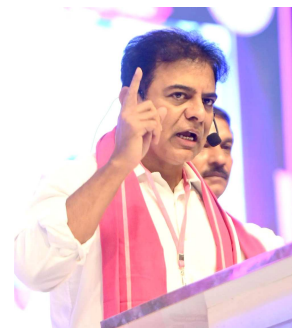
హైదరాబాద్, మే 21 : పంట కొనుగోళ్ల సంక్షోభంపై ఎన్నో మొద్దునిద్ర ముఖ్యమంత్రి గారు అని బీఆర్ఎస్ వర్కింగ్ ప్రెసిడెంట్ కేటీఆర్ ప్రశ్నించారు. కేబినెట్ మిటింగ్ లోనైనా కళ్లు తెరవండి అని హితవు పలికారు. రైతుల ప్రాణాలు పోతున్నా.. పంటలు కొనరా..? కొనుగోలు కేంద్రాల్లో కుప్పకూలుతున్నా కనికరించరా అని మండిపడ్డారు. దాన్యం తగలబెట్టుకుంటున్నా తండ్రి తీర్చరా అని ప్రశ్నించారు. ఈ మేరకు సిఎం రేవంత్ రెడ్డికి కేటీఆర్ బహిరంగ లేఖ రాశారు. కొనుగోలు కేంద్రాల్లో

- రైతులు పట్టణాలకు రావడం దాన్యం కొనరా - ఇప్పటికైనా మొద్దు నిద్ర వీడండి సిఎం గారు - 23న జరిగే కేబినెట్ భేటీలో అయినా చర్చించండి - సిఎం రేవంత్ కు కెటిఆర్ బహిరంగ లేఖ (ప్రజాఅక్షయ ప్రతినిధి) హైదరాబాద్, మే 21 : పంట కొనుగోళ్ల సంక్షోభంపై ఎన్నో మొద్దునిద్ర ముఖ్యమంత్రి గారు అని బీఆర్ఎస్ వర్కింగ్ ప్రెసిడెంట్ కేటీఆర్ ప్రశ్నించారు. కేబినెట్ మిటింగ్ లోనైనా కళ్లు తెరవండి అని హితవు పలికారు. రైతుల ప్రాణాలు పోతున్నా.. పంటలు కొనరా..? కొనుగోలు కేంద్రాల్లో కుప్పకూలుతున్నా కనికరించరా అని మండిపడ్డారు. దాన్యం తగలబెట్టుకుంటున్నా తండ్రి తీర్చరా అని ప్రశ్నించారు. ఈ మేరకు సిఎం రేవంత్ రెడ్డికి కేటీఆర్ బహిరంగ లేఖ రాశారు. కొనుగోలు కేంద్రాల్లో