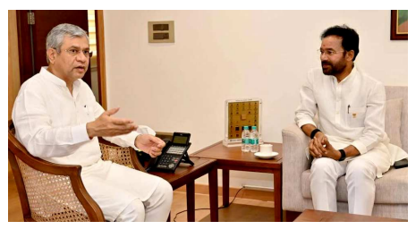
హైదరాబాద్, మే 21 : తెలంగాణ రాష్ట్రంలో రవాణా రంగాన్ని సరికొత్త ఎత్తుకు తీసుకెళ్లాలా కేంద్ర ప్రభుత్వం మరో శుభవార్త చెప్పింది. రాష్ట్రంలో ఎప్పటి నుంచో పెండింగ్ లో ఉన్న కీలకమైన మణుగూరు-రామ

- రూ. 5,818.45 కోట్ల భారీ అంచనా వ్యయంతో నిర్మాణం - మారుమూల గిరిజన పల్లెలకు పట్టణున్న మహార్లక - రైల్వే ప్రాజెక్టులపై అశ్వినీ వైష్ణవ్ తో కిషన్ రెడ్డి చర్చ (ప్రజాఅక్షయ న్యూస్ బ్యూరో) న్యూఢిల్లీ, మే 21 : తెలంగాణ రాష్ట్రంలో రవాణా రంగాన్ని సరికొత్త ఎత్తుకు తీసుకెళ్లాలా కేంద్ర ప్రభుత్వం మరో శుభవార్త చెప్పింది. రాష్ట్రంలో ఎప్పటి నుంచో పెండింగ్ లో ఉన్న కీలకమైన మణుగూరు-రామ