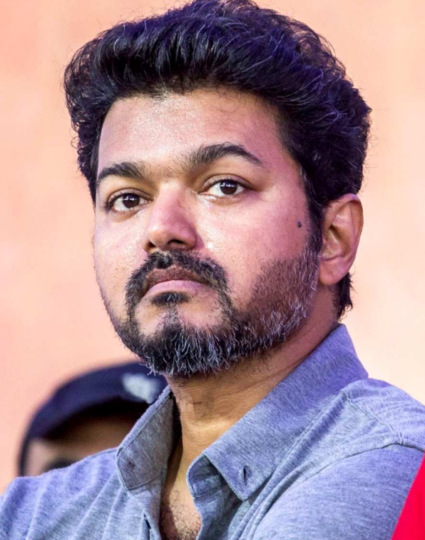
ఆగిపోవడంతో ప్రభుత్వం ఏర్పాటుకు అవసరమైన సంఖ్యాబలం కోసం ఆయన ఇతర చిన్న పార్టీల మీద లేదా స్వతంత్రుల మీద ఆధారపడాల్సి ఉంటుంది. ఇది ఆయనకు రాజకీయ పరిణామాల పరీక్షించే సమయం.

మరోవైపు, సంప్రదాయ పార్టీలైన డిఎంకె, ఏఐఎడిఎంకెలు తమ ఓటు బ్యాంకును కాపాడుకోవడంలో కొంత తడబడ్డాయి. అధికార పార్టీపై ఉన్న వ్యతిరేకత మరియు ప్రతిపక్ష పార్టీలో ఉన్న నాయకత్వ లోపం విజయ్ కు సానుకూలంగా మారాయి. విజయ్ తన ప్రసంగాల్లో ద్రావిడ సిద్ధాంతాన్ని గౌరవిస్తూనే, ఆ సిద్ధాంతం పేరుతో జరుగుతున్న కుటుంబ పాలనను, అవినీతిని ఎండగట్టడం సామాన్య ప్రజలను ఆకట్టుకుంది. ద్రావిడ భావజాలం అంటే కేవలం రాజకీయ అధికారం కాదని, అది ప్రజల జీవన ప్రమాణాలను పెంచే సాధనమని ఆయన చేసిన వాదన కొత్త చర్చకు దారితీసింది. అయితే, 108 స్థానాల వద్ద