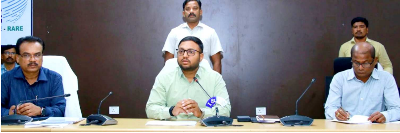
జిల్లావ్యాప్తంగా 1,28,101 మంది పాల్గొన్నారు. 1,30,716 కిలోల ఘన వ్యర్థాలను తొలగించారు. 1,910 కార్యాలయ భవనాలను శుభ్రపరిచారు. 4,443 పెండింగ్ ఫైళ్లను పరిష్కరించారు.

మార్చి 6 నుంచి 15 వరకు నిర్వహించిన పరిశుభ్రత, పుష్కర క్రియరెస్ కార్యక్రమాల్లో