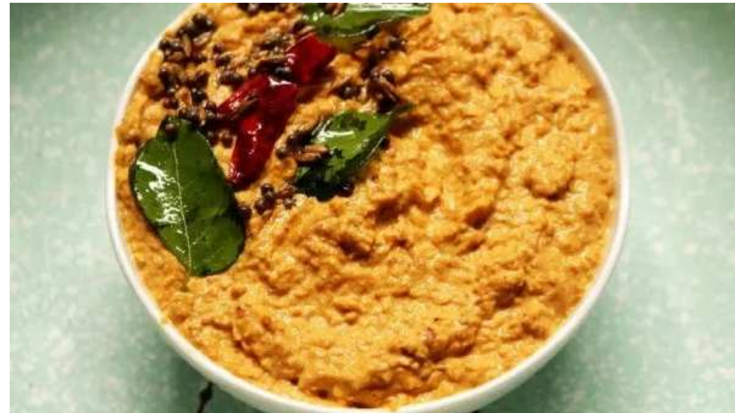
అవసరమైతే కొద్దిగా నీరు కూడా కలుపుకోవచ్చు. ఇప్పుడు ఒక చిన్న పాన్ లో నూనె వేసి ఆవాలు