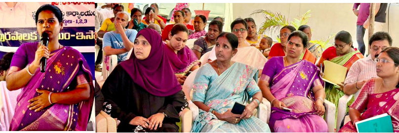
తీర్చిదిద్దగలమని, ప్రతి వార్డులోనూ పారదర్శకంగా, ప్రణాళికాబద్ధంగా అభివృద్ధి పనులు జరిగేలా చూస్తామని హామీ ఇచ్చారు.

ప్రజా పాలన-ప్రగతి ప్రణాళిక అమలులో సూర్యాపేట జిల్లా చూపిన చొరవ, సాధించిన ఫలితాలు రాష్ట్రంలోని ఇతర జిల్లాలకు ఆదర్శంగా నిలుస్తున్నాయని పలువురు అభిప్రాయపడుతున్నారు. ప్రజలకు చేరువైన పరిపాలన, సమర్థవంతమైన అమలు, క్షేత్రస్థాయి పర్యవేక్షణతో సూర్యాపేట జిల్లా ప్రత్యేక గుర్తింపు సాధించిందనే అభిప్రాయం వ్యక్తమవుతోంది.