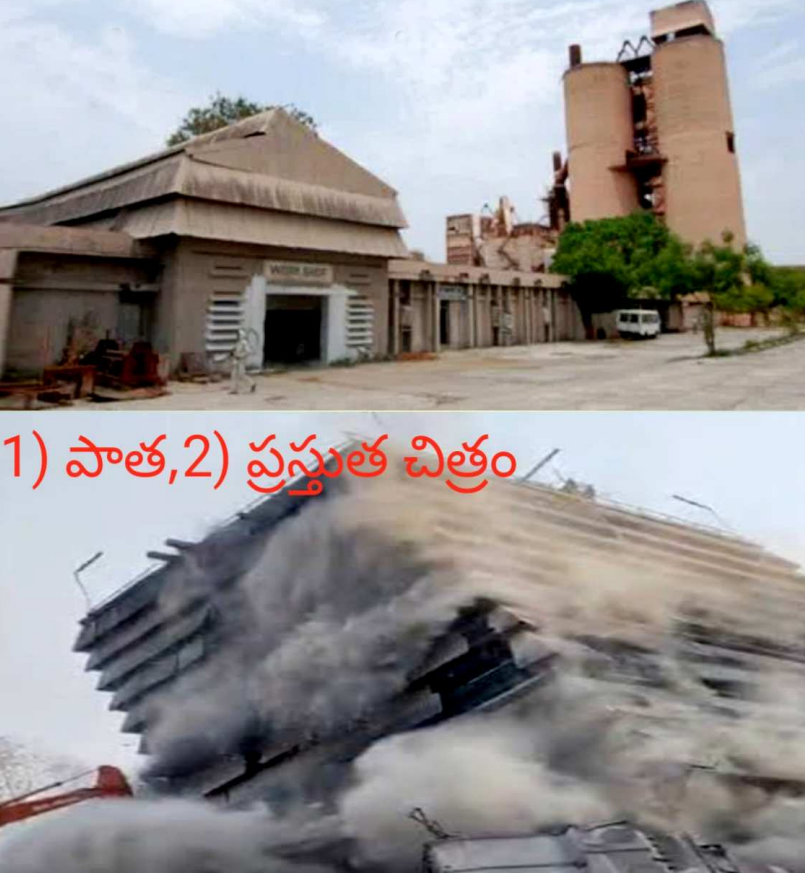
1) పాత, 2) ప్రస్తుత చిత్రం ప్రయత్నాలు వృధా అయినది. కేంద్ర, రాష్ట్ర ప్రభుత్వాలు సమితి ప్రేమను సిసిబి పై చూపెట్టినది. అత్యధికంగా సున్నపు విలువలు ఉన్నప్పటికీ మూసివేసే దిశగానే ప్రభుత్వాలు మొగ్గుచూపించాయి. 2018 వ సంవత్సరంలో అదిలాబాద్ అసెంబ్లీ నియోజకవర్గ ఎన్నికల సమయంలో సిమెంట్ పరిశ్రమ పురోధరణికి చర్యలు తీసుకుంటానని నాటి భారతీయ జనతా పార్టీ అగ్ర నాయకులు

1991లో నాటి కాంగ్రెస్ ప్రభుత్వం నేతృత్వంలోని ప్రభుత్వం తీసుకువచ్చిన పారిశ్రామిక సంస్కరణల మూలంగా అదిలాబాద్ సిమెంట్ ఫ్యాక్టరీకి వినాశకరమైన ప్రభావాన్ని చూపించినది. కేంద్రం వాటా నిర్వహణ మూలకం నిలిచిపోయినది మరియు ఉత్పత్తి ఆయన సిమెంట్ లో 60% శాతం కేంద్ర ప్రభుత్వం కొనుగోలు మానివేసేయడం మూలంగా ఫలితంగా నిర్వహణ నష్టాల కారణంగా 1998 నవంబర్లో ఈ పరిశ్రమ లో పక్షికంగా మూస వేసినారు. 2008వ సంవత్సరంలో పరిశ్రమలో అన్ని కార్యకలాపాలు పూర్తిగా ఆపివేసినది దశాబ్ద కాలముగా కాలముగా నిలిచిపోయిన ఈ ప్లాంట్ ను శాశ్వతంగా మూసివేస్తారా! అనే అనుమానానికి ఆస్త్రంత పని చేశారు. పునరుద్ధరణ అంశం చిరకాల కోరికగానే మిగిలిపోయినది సిసిబి సాధన కమిటీతో పాటు, కార్మిక సంఘాలు చేసిన