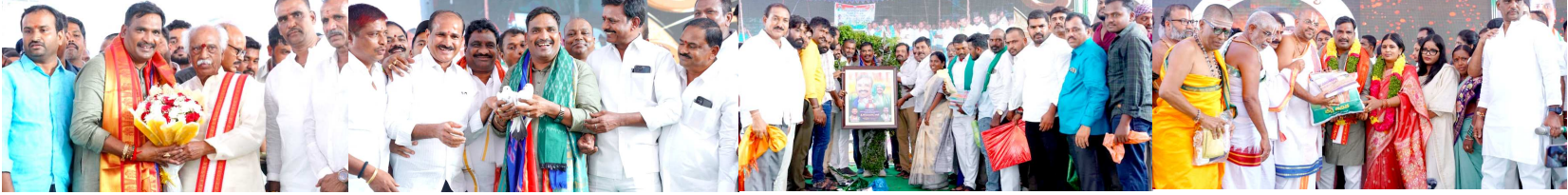
గజమాలులు, సీవా కార్యక్రమాలతో వివే బీర్ల ఐలయ్య జన్మదిన వేడుకలు